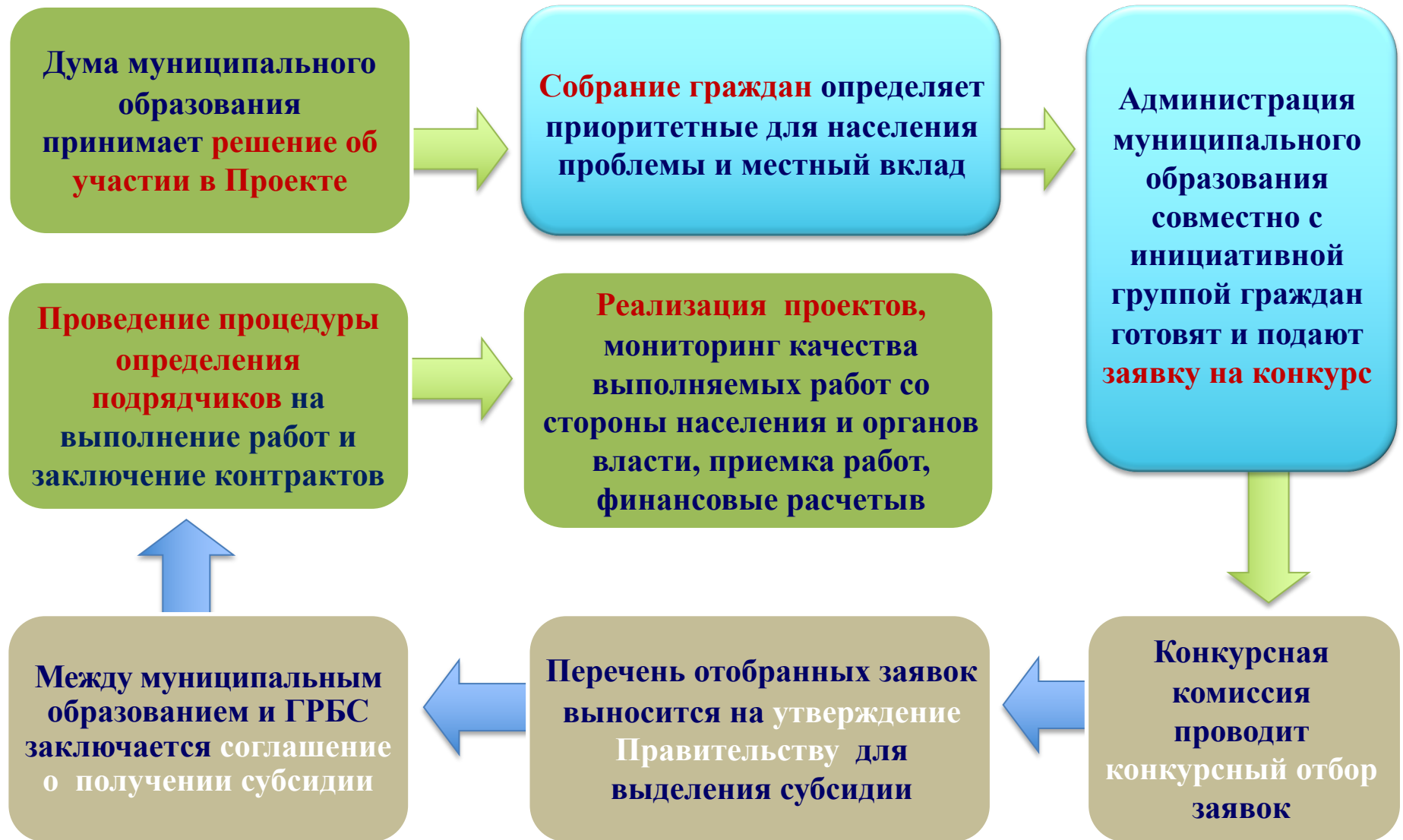
Схема реализации ППМИ-1,5 годичный цикл